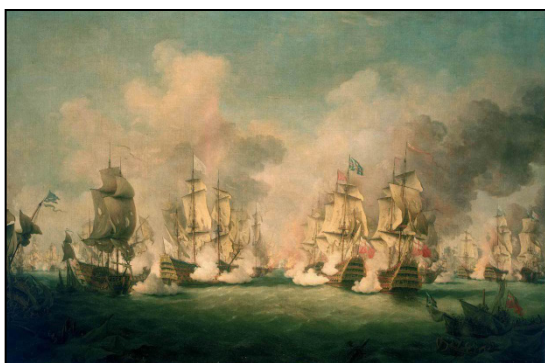
The Battle of Barfleur, 19 May 1692, Naval Museums Greenwich