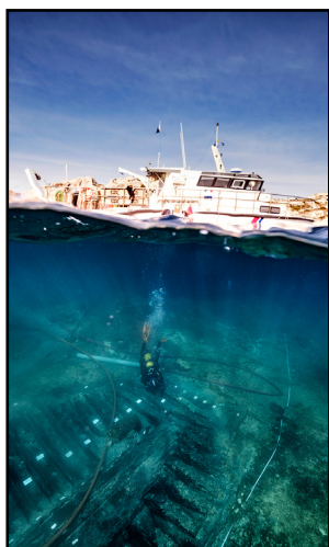
Vue mi-air mi-eau des vestiges

Lors d'une plongée en 1977 dans le port naturel de Pomègues, l'une des îles de l'archipel de Frioul au large de Marseille, les vestiges d'un navire recouvert de cailloutis calcaires et de sable fin ont été clairement localisés. Avec, par endroits, des pièces de bois et des éléments de doublage de plomb. Épave antique ou épave moderne ? Sans mobilier archéologique, elle n'intéressait pas encore les hommes de savoir, puisqu'il n'y avait pas d'amphores !