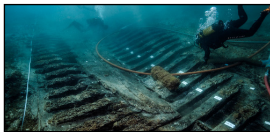
Vue d'ensemble de l'épave

Nous avons ensuite sollicité Éric Rieth (Directeur de recherche au CNRS (LAMOP), Musée national de la Marine, Palais de Chaillot, Paris) . Sa réponse neutralise notre hypothèse de départ : « Cela ne ressemble pas à une structure de type antique mais plutôt à une architecture d'époque XVI e -XVII e siècles, cohérente au demeurant, avec l'usage d'un doublage en plomb [...], les attestations archéologiques sembleraient être rares à partir de la fin du XVII e siècle. Bien entendu, il s'agit là d'une interprétation à considérer avec prudence. »